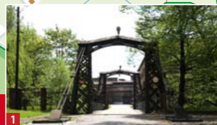
1 Najstarszy w Europie most wiszący projektu K. Schotteliusa z 1827 roku.

Urząd Gminy i Miasta Ozimek, ul. Dzierżona 4B, 46-040 Ozimek tel.: +48 77 465 13 88, 465 19 82, fax +48 77 465 12 81 e-mail: sekretariat@ugim.ozimek.pl www.ozimek.pl