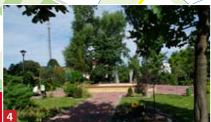
4 Plac Europejski.