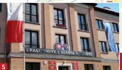
5 Urząd Gminy i Miasta.